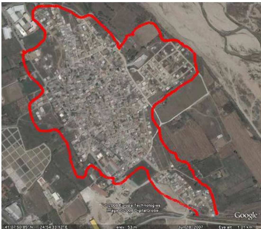
Αεροφωτογραφία του Δροσερού – Ξάνθης

Το 2001 το Υπουργείο Εσωτερικών δημιούργησε «Το Ολοκληρωμένο Πρόγραμμα Δράσης (ΟΠΔ) για Κοινωνική Ένταξη των Ελλήνων Τσιγγάνων» για τις περιόδους 1996-1998, 1998-2000, 2005-2007). Για το πρόγραμμα αυτό δαπανήθηκαν πολλά εκατοντάδες ευρώ. Όμως το μεγάλο ερώτημα είναι πού πήγαν όλα τα κονδύλια για την υλοποίηση του; Πού ή σε ποιούς διατέθηκαν; Τι υπάρχει στην πραγματικότητα (όχι στο χαρτί) ως αποτέλεσμα αυτής της ιδιαίτερα υψηλής χρηματοδότησης από την Ευρωπαϊκή Ένωση για την κοινωνική ένταξη των τσιγγάνων; Πού είναι αυτοί, τσιγγάνοι και μη, που είχαν εμπλακεί στον σχεδιασμό, στην άντληση των κονδυλίων και στην υλοποίηση αυτού του αποτυχημένου προγράμματος; Μήπως σήμερα επιβραβεύονται με την ανάληψη θέσεων σχετικά με τα ζητήματα των Ρομά; Αν τότε δεν τα έκαναν καλά με τόσους πόρους θα τα κάνουν τώρα; Η είναι όλα μόνο αποτέλεσμα της παράλειψης, στο τότε πρόγραμμα, 'μηχανισμού παρακολούθησης'; Τυχαίο;