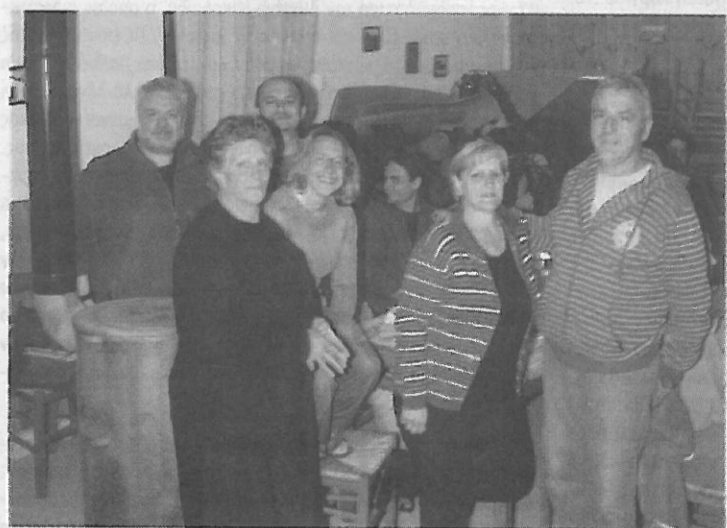
Φιλοξενία στην Κίρκη

«Υπάρχει πιθανότητα να υπάρχουν πολλά είδη προς εξαφάνιση εδώ, αν και δεν υπάρχει πολύ ανθρώπινη δραστηριότητα, δεν υπάρχει πολύς τουρισμός. Βασικά, είμαστε όλοι Ευρωπαίοι επιστήμονες και θέλουμε να μιλάμε με ανθρώπους για το τι κάνουν με τα οικοσυστήματα τους και να μην ασχολούμαστε μόνο με τα τροπικά δάση, αλλά να κοιτάξουμε, να διαχειριστούμε τα δικά μας, γι' αυτό πρέπει να δώσουμε έμφαση εδώ», επιμένει ο κ. καθηγητής Πανεπιστημίου Μάρτιν Κόνβιτσα.