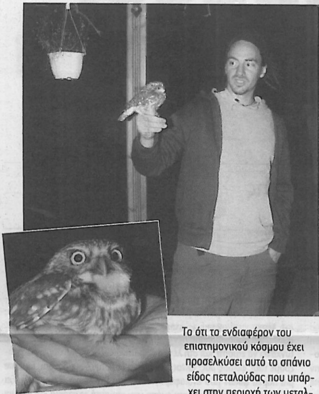
Το ότι το ενδιαφέρον του επιστημονικού κόσμου έχει προσελκύσει αυτό το σπάνιο είδος πεταλούδας που υπάρχει στην περιοχή των μεταλλείων της Κίρκης στο δήμο Αλεξανδρούπολης και στη Χίο δεν είναι τυχαίο, αλλά σε συνδυασμό με την προσπάθεια να συνυπάρξουν σύγχρονες μέθοδοι αγροτικής εκμετάλλευσης με την βιοποικιλότητα της περιοχής σε αρμονία είναι το ζητούμενο.

Ο καθηγητής Μάρτιν Κόνβιτσα έχει αναλώσει ένα σημαντικό μέρος της έρευνάς του στο τομέα αυτό, παροτρύνοντας και τους 40 νέους επιστήμονες από τη Τσεχία να δουν από κοντά ένα ιδιαίτερα πλούσιο σε καταγραφή περιβάλλον που διαθέτει η Ελλάδα, αφού οι μέχρι τώρα προσλαμβάνουσες ήταν από γειτονικές χώρες της Τσεχίας όπως η Σλοβακία και η Πολωνία.