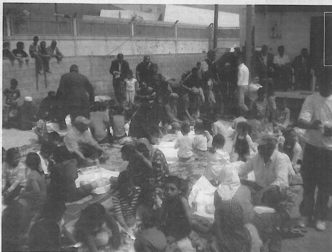
Γεύμα στην αυλή του σπιτιού που γινόταν η τελετή σουνέτ

Η πινακίδα πάντως που τοποθετήθηκε με το Β.35 παραμένει αίνιγμα εκτός εάν καταγράψει τον αριθμό τέτοιων τελετών σουνέτ που κάνει η ανάλογη ομάδα νοσηλευτών της Τουρκίας.