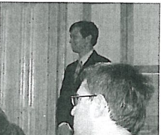
Ο πρόξενο των ΗΠΑ στη Θεσσαλονίκη κ. Μπράιαν Χόιτ Γι δίνει ευχαριστήριες με την επίλογό της κ. Σουλεϊμάν για το βραβείο