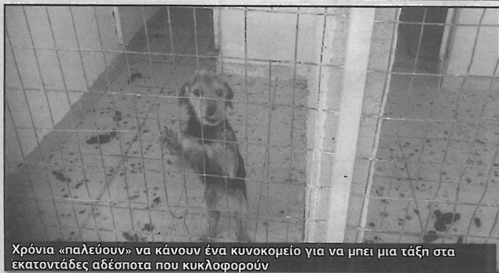
Χρόνια «παλεύουν» να κάνουν ένα κυνοκομείο για να μπει μια τάξη στα εκατοντάδες αδέσποτα που κυκλοφορούν

Το κυνοκομείο δεν λύνει το πρόβλημα με τα αδέσποτα», υποστηρίζει ο αντιδήμαρχος Τ. Θεοδωρίδης. Συνεχίζονται οι στείρωσεις και οι εμβολιασμοί